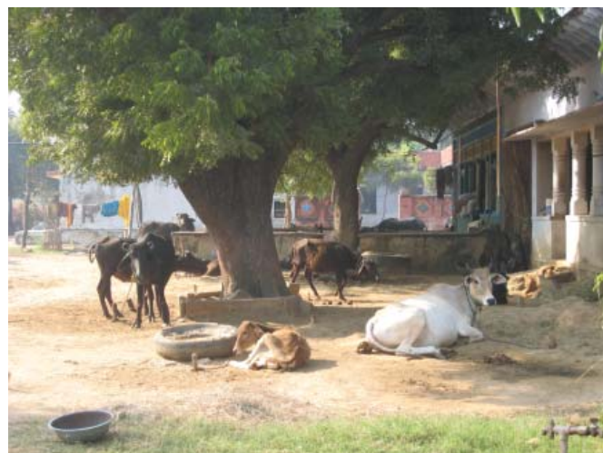
Raaka-ainetta biokaasuvoimoihin on saatavilla helposti kotipihalta.

Intian biokaasu -hanke saa kehitysyhteistyötukea myös Suomen ulkoasiainministeriöltä.